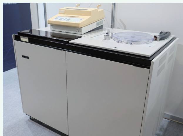
835形日立高速アミノ酸分析計(株式会社日立ハイテクサイエンス 那珂事業所 所蔵)

本装置は、アミノ酸分析計の初期からHPLC機に至る技術の変遷を詳細に把握することができる貴重な装置であり、化学遺産として認定する。